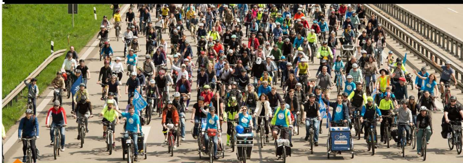
Nächste Münchner ADFC-Radsternfahrt am Sonntag, 21.4.2024

Abfahrtszeiten im Landkreis Fürstfeldbruck siehe https://muenchen.adfc.de/sternfahrt