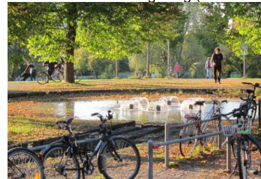
Herbststimmung im Münchener Westpark