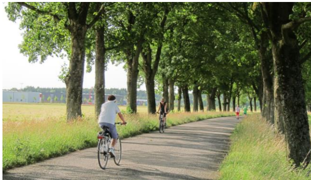
Verbliebene Radfahrerallee gegenüber dem Freihamer Gewerbegebiet, die Freihamer Allee

→ Bahnhofstraße (Bahnunterführung passieren und danach im Kreisel geradeaus, dann dritte Straße links) → Würmstraße (nach ca. 300m