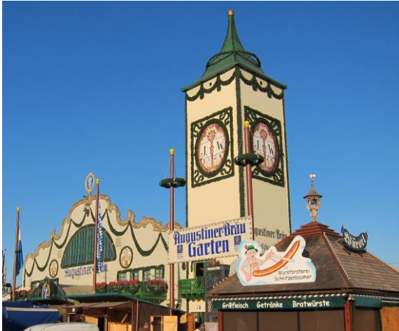
Oktoberfest auf der Theresienwiese

→ nach Überquerung der Theresienhöhe erreichen Sie auf der Theresienwiese das Ziel.