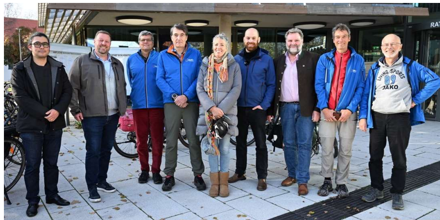
Radtour der Bürgermeisterkandidaten von Gröbenzell

Zur Verbesserung der Radfahr-Infrastruktur hatte die Gemeinde Gröbenzell 2019 ein Radfahrkonzept erstellen lassen, das konkrete Handlungsmaßnahmen aufzeigt, mit denen sich die Situationen verbessern lassen.